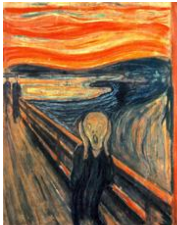
Le cri, Edvard Munch

Observe attentivement l'expression du personnage. D'après toi, que ressent le personnage ?